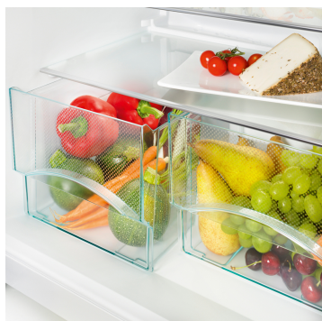
Cassetti trasparenti per frutta e verdura

Nei congelatori NoFrost e SmartFrost i cassetti e i sottostanti piani intermedi in vetro possono essere facilmente estratti. Nasce in questo modo VarioSpace, il pratico sistema per la creazione di un extra spazio utile affinché anche i prodotti più grandi possano trovare rapidamente spazio.