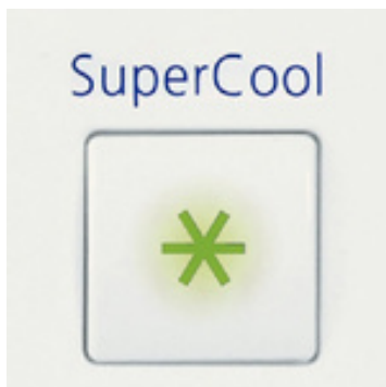
Funzione temporizzata SuperCool

Nel vano congelatore 4 stelle possono essere conservati generi alimentari freschi per un lungo periodo. Le temperature pari a -18 °C e inferiori garantiscono provviste che rispettano gli apporti vitaminici e di minerali dei cibi.