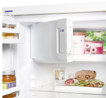
Vano congelatore 4 stelle

Nel vano congelatore 4 stelle possono essere conservati generi alimentari freschi per un lungo periodo. Le temperature pari a -18 °C e inferiori garantiscono provviste che rispettano gli apporti vitaminici e di minerali dei cibi.