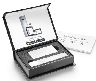
SmartDeviceBox integrabile in un secondo momento

Nessuno scambio dell'aria tra il vano frigorifero e il vano congelatore grazie ai due circuiti di refrigerazione completamente indipendenti che caratterizzano DuoCooling. Gli alimenti preservano così la loro freschezza e non ha luogo alcun passaggio di odori. In altre parole: minore spreco, acquisti meno frequenti ma, al contempo, maggior risparmio e migliore conservazione del cibo.